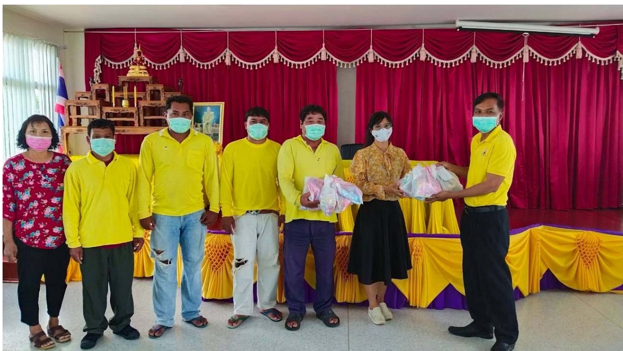
คณะผู้บริหารมอบถุงยังชีพให้กับพนักงานเทศบาล พนักงานครูเทศบาล ลูกจ้างประจำ และพนักงานจ้าง ในช่วงสถานการณ์วิกฤตการแพร่ระบาดของโรคติดเชื้อไวรัสโคโรนา ๒๐๑๙